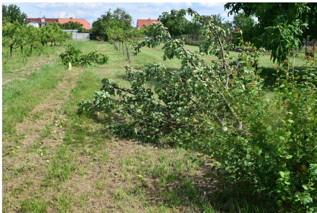
Obr. 1. Ovocný sad na severu obce Lanžhot – za domy v ulici Stráže.

Podle předběžných informací bylo nejvíce zasaženo okolí Zámečku Lanžhot a přilehlá Zámecká ulice a dále jih až jihovýchod k fotbalovému hřišti. Další informace ze sociálních sítí poukazyvaly i na škody v severní části obce na ulici Vinohrady. Podle oficiálních údajů zjištěných po odklizení škod bylo poškozeno 30 domů, velké množství stromů, automobily, elektrické vedení apod. Většina stromů byla v den terénního šetření již odklizená.