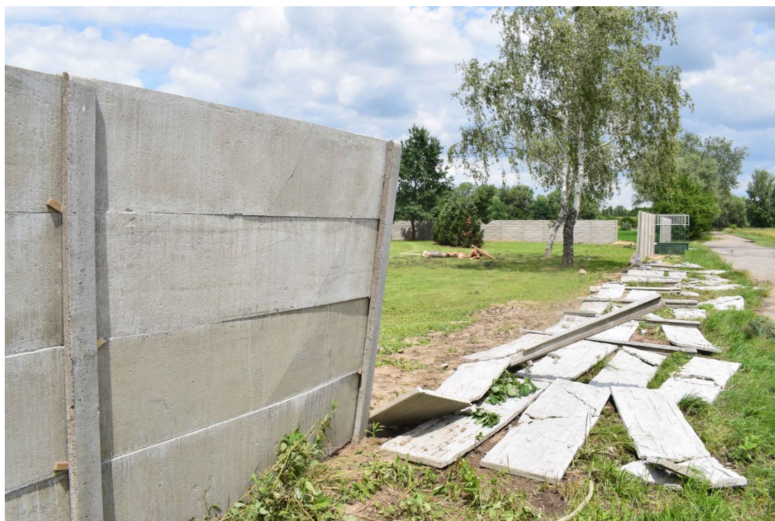
Obr. 5. Betonový plot položený v místech dráhy tornáda, které prošlo přes areál fotbalového hřiště.

Podle rozšíření škod na budovách na konci ulice Boženy Němcové začalo docházet zřejmě k zužování víru a tím i k zesílení jeho rotace mezi ulicemi B. Němcové a tokem Kyjovky. Poškozené střechy nebo okna se totiž objevovaly najednou v pásu jen cca 50 m. Z jednoho vyššího domu ulétla celá plechová střecha (IF0+ až IF1), která byla odnesena do Kyjovky. Za tokem Kyjovky v zahradní kolonii byly vyvráceny vyšší stromy a zlomený 90letý dub (IF1), jehož kmen však nebyl zcela zdravý. Další škody byly soustředěny do areálu fotbalového hřiště, kde v poměrně úzkém pásu (asi 50 m) byly vyvráceny nebo zlomeny (obr. 4) vzrostlé borovice (opět doleva od směru postupu – IF1+), zatímco plechová střecha tribuny byla netknutá. V délce cca 25 m byl vyvrácen plot z betonových panelů i s přelomenými betonovými sloupky a to ve směru postupu tornáda pryč z prostoru hřiště (obr. 5). Poškození plotu není vyloučeno s dopomocí části letících nedalekých borovic.