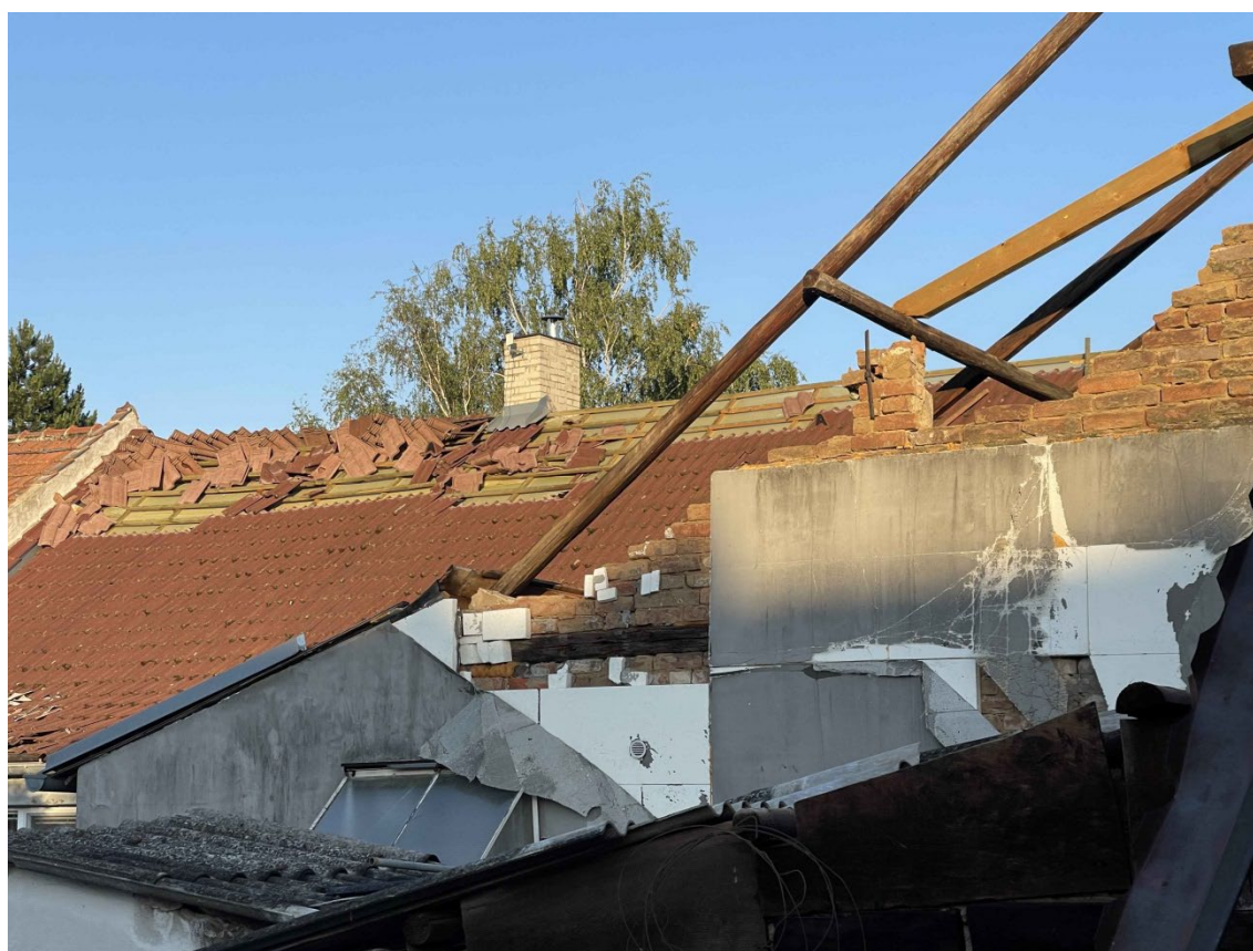
Obr. 2. Střeška domu na ulici Zámecká – střešní krytina shrnutá podle směru proudění.