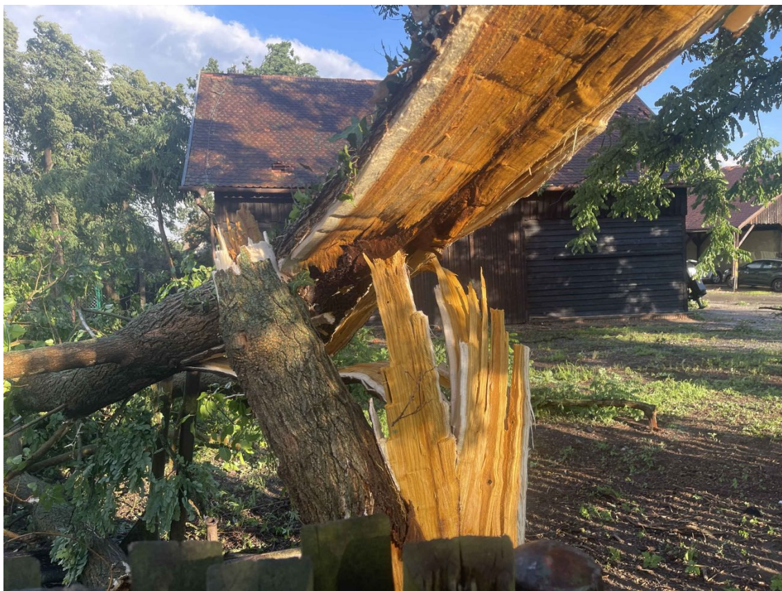
Obr. 3. Zlomený a zkroucený strom v parku Zámečku Lanžhot.