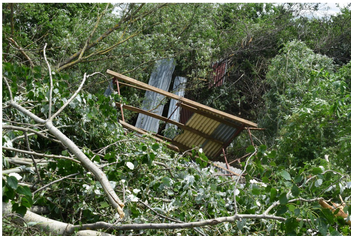
Obr. 6. Konstrukce neukotveného přístřešku z místního ranče společně s vyvrácenými a polámanými stromy.