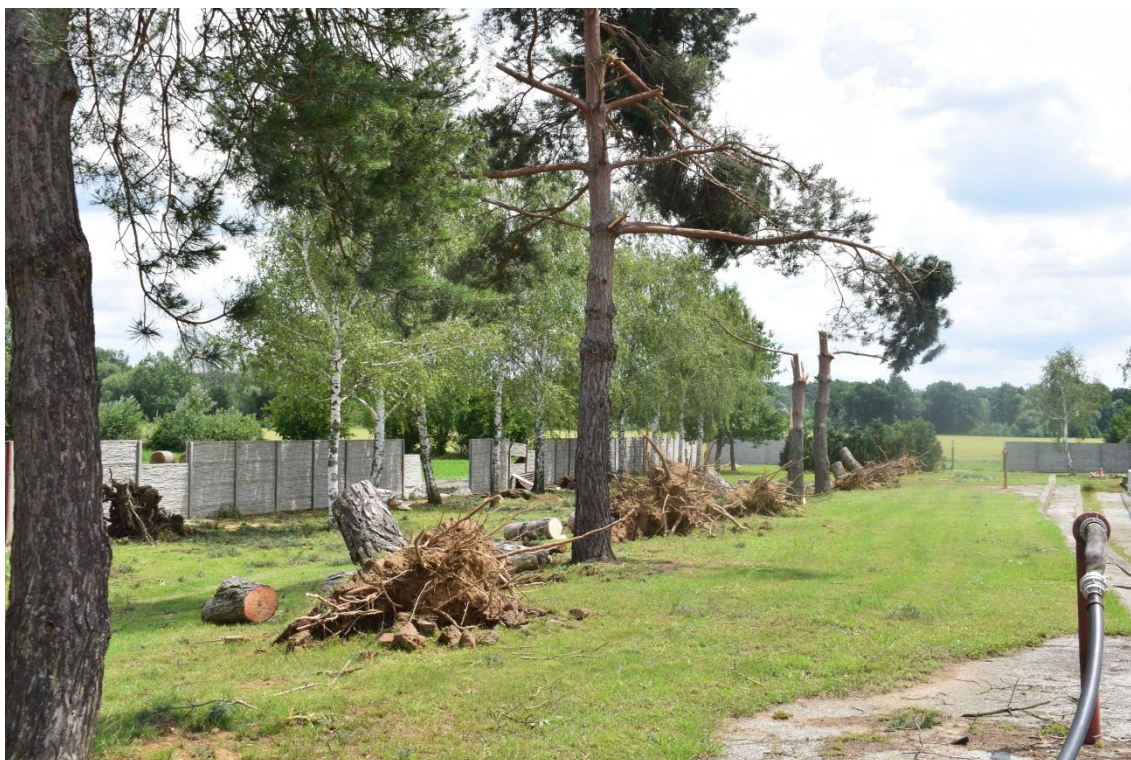
Obr. 4. Vyvrácené a polámané borovice u fotbalového hřiště.